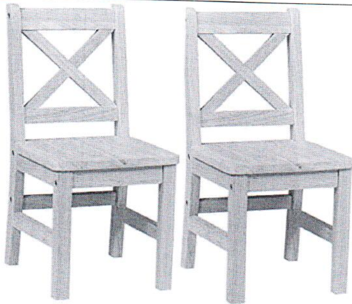
IMAGEN REFERENCIAL SEGÚN ESPECIFICACIONES TÉCNICAS DE PRONIED