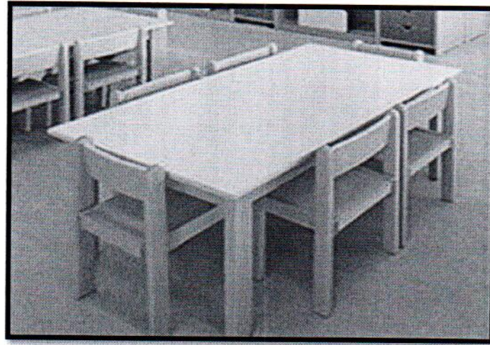
IMAGEN REFERENCIAL SEGÚN ESPECIFICACIONES TÉCNICAS DE PRONIED