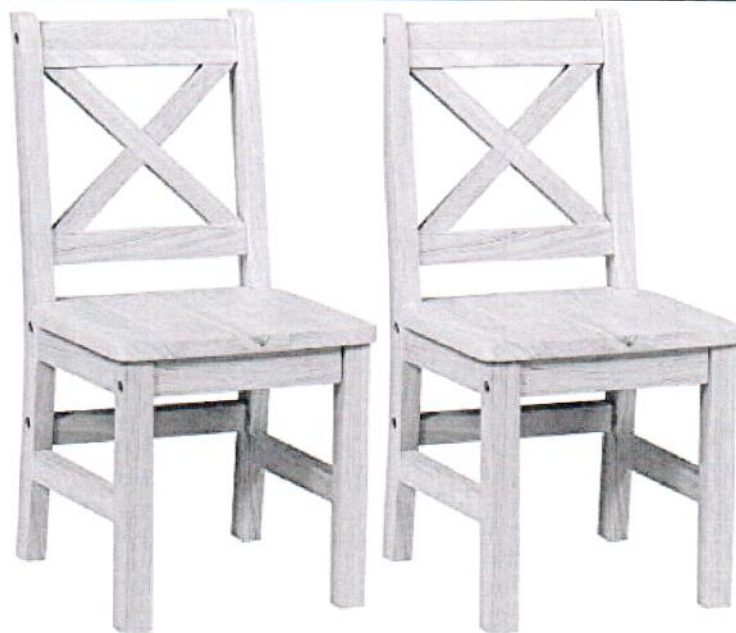
IMAGEN REFERENCIAL SEGÚN ESPECIFICACIONES TÉCNICAS DE PRONIED