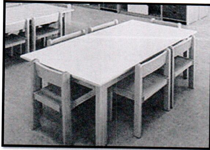
IMAGEN REFERENCIAL SEGÚN ESPECIFICACIONES TÉCNICAS DE PRONIED